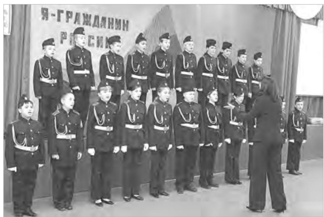
Кадеты этой школы не только изучают общие дисциплины, но и маршируют, стреляют и даже поют