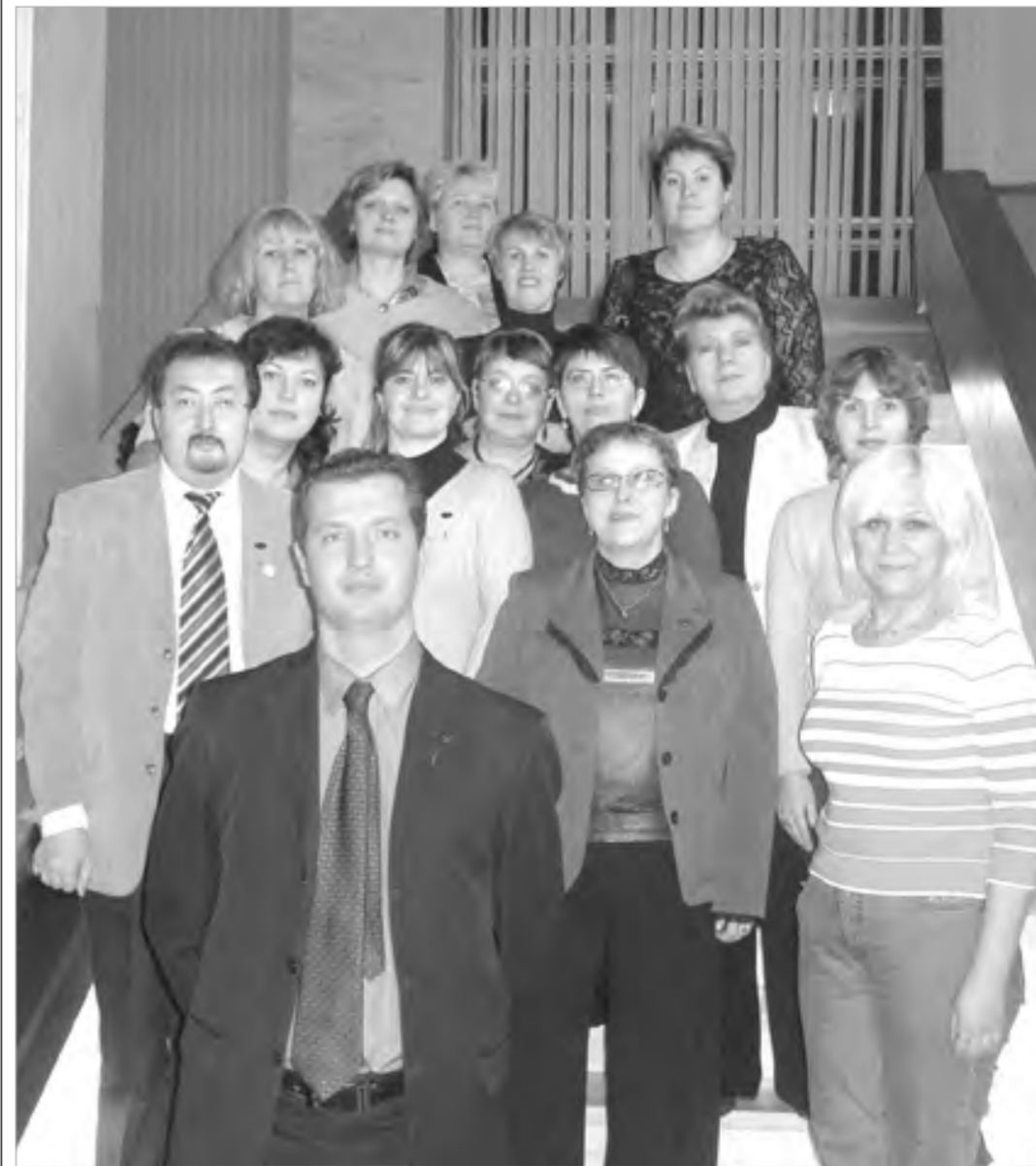
Команда образовательной системы Ленинского района Челябинска — участник очной защиты на статус федеральной экспериментальной площадки

Много воспоминаний, добрых слов о коллегах прозвучало в этот вечер. Встреча единомышленников и соратников породила идею учреждения премии имени Н. Ф. Сироткина для лучших руководителей образовательных учреждений района.