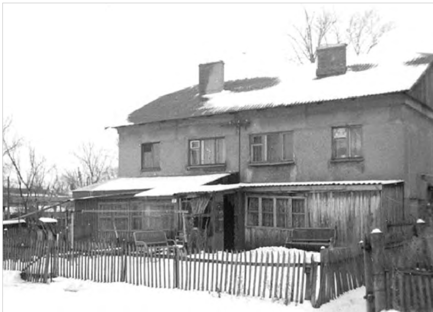
Это те самые «коттеджи» в Агаповском районе. Вверху — дом на четыре семьи

Мы продолжаем обсуждать тему реализации права сельских педагогов на бесплатную жилую площадь с отоплением и освещением